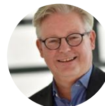
pierre de vos